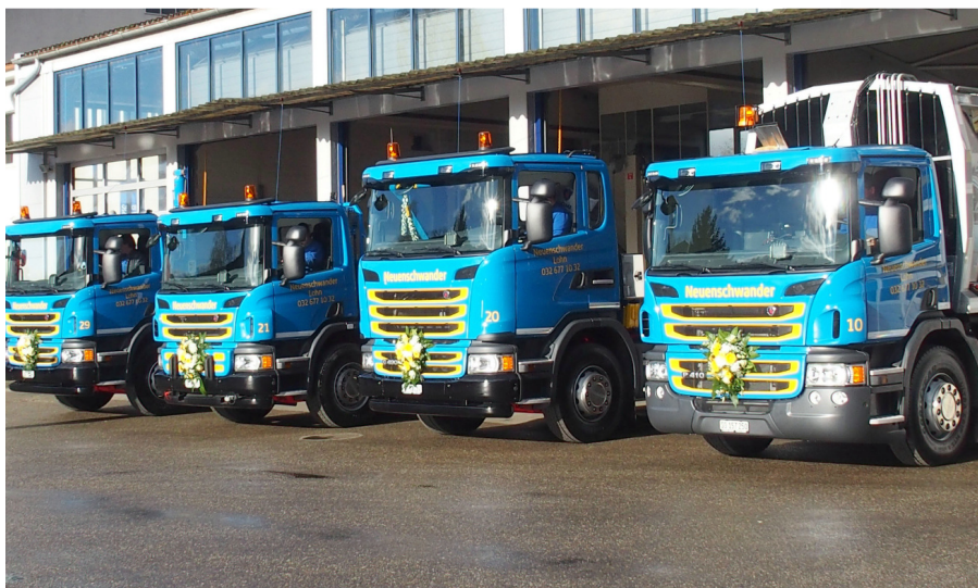
Remise des camions à Kallnach.

Scania Suisse SA Steinackerstrasse 57 CH-8302 Kloten