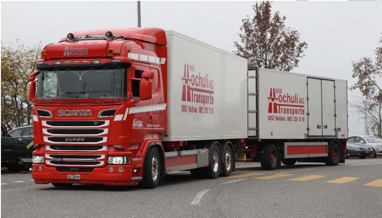
Der neue Scania R520 LB 6x2*4 der Willi Hochuli AG in Reitnau.

Scania Schweiz AG Steinackerstrasse 57 CH-8302 Kloten