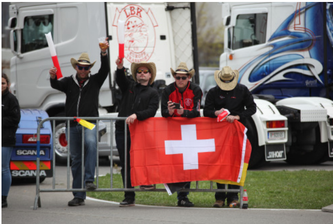
Lautstarke Unterstützung aus der Schweiz.