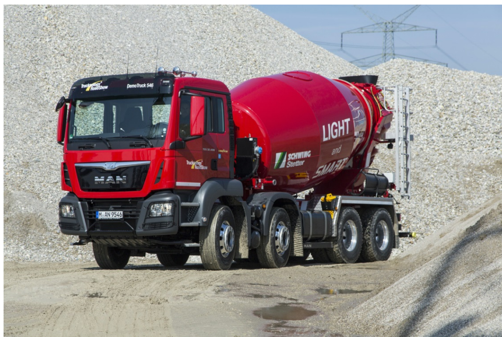
Un classique sur les chantiers : le MAN TGS 32.400 8x4 BB comme malaxeur à béton