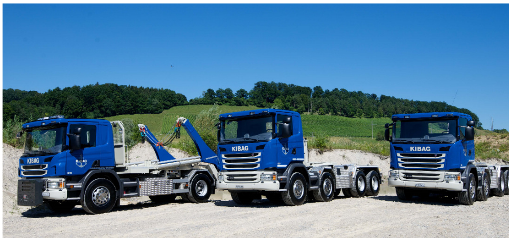
Gruppenbild mit allen drei neuen Scania Baurucks.