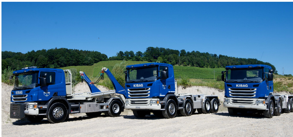
Photo de groupe avec les trois camions de chantier Scania neufs.