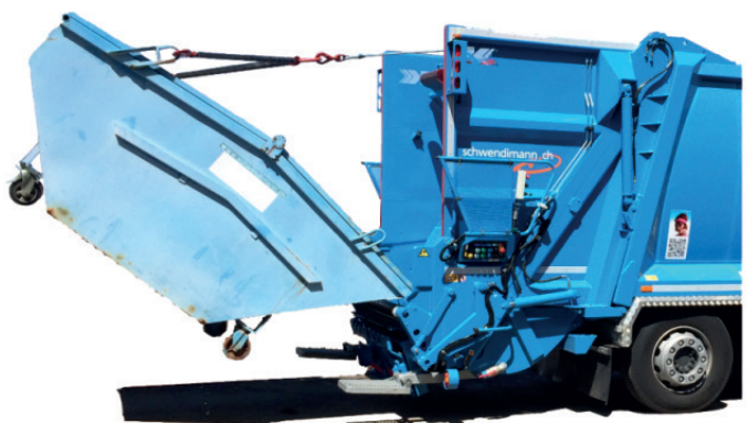
Seilwinde für 5m 3 Mulden