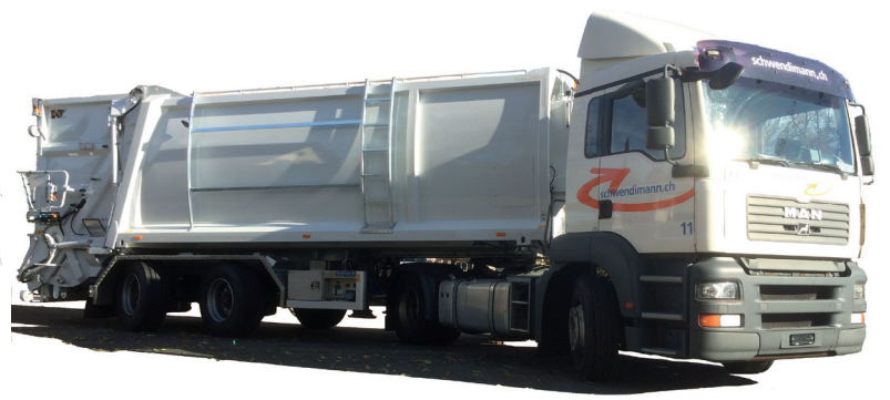
Kaoussis Mega-Hecklader HAS46