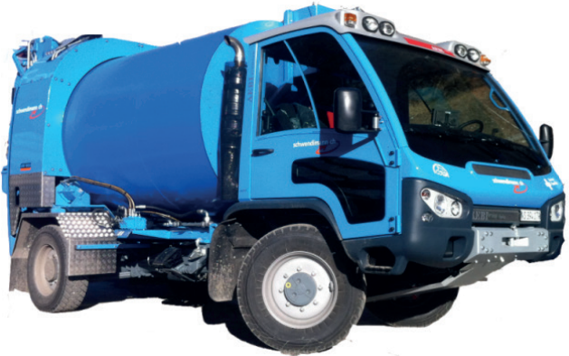
Kaoussis RotoPresser CRV1600