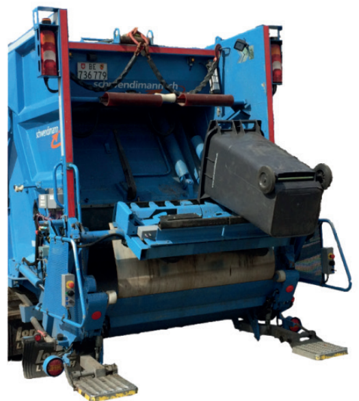
Behälter-Identifikation und Schüttungswaage