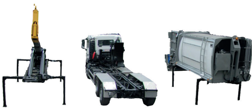
Kaoussis CRV2000 Wechselsystem (Kehrichtaufbau, Hakengerät)