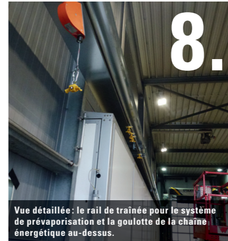
8. Vue détaillée: le rail de trainée pour le système de pré-vaporisation et la goulotte de la chaîne énergétique au-dessus.