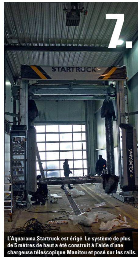
7. L'Aquarama Startruck est érigé. Le système de plus de 5 mètres de haut a été construit à l'aide d'une chargeuse télescopique Manitou et posé sur les rails.