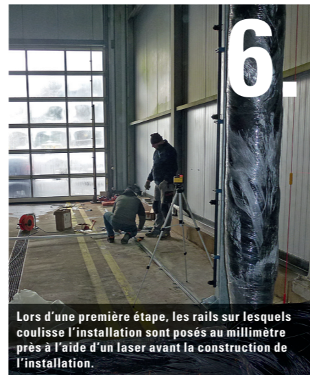
6. Lors d'une première étape, les rails sur lesquels coulissera l'installation sont posés au millimètre près à l'aide d'un laser avant la construction de l'installation.