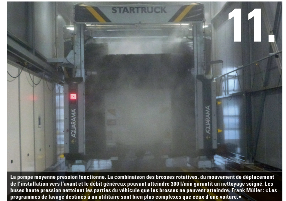
11. La pompe moyenne pression fonctionne. La combinaison des brosses rotatives, du mouvement de déplacement de l'installation vers l'avant et le débit généreux pouvant atteindre 300 l/min garantit un nettoyage soigné. Les buses haute pression nettoient les parties du véhicule que les brosses ne peuvent atteindre. Frank Müller: « Les programmes de lavage destinés à un utilitaire sont bien plus complexes que ceux d'une voiture. »