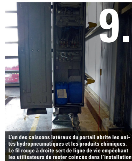
9. L'un des caissons latéraux du portail abrite les unités hydropneumatiques et les produits chimiques. Le fil rouge à droite sert de ligne de vie empêchant les utilisateurs de rester coincés dans l'installation.