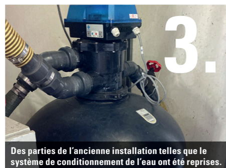
3. Des parties de l'ancienne installation telles que le système de conditionnement de l'eau ont été reprises.