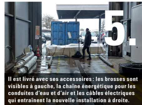
5. Il est livré avec ses accessoires: les brosses sont visibles à gauche, la chaîne énergétique pour les conduites d'eau et d'air et les câbles électriques qui entraînent la nouvelle installation à droite.