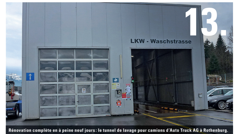
13. Rénovation complète en à peine neuf jours: le tunnel de lavage pour camions d'Auto Truck AG à Rothenburg.