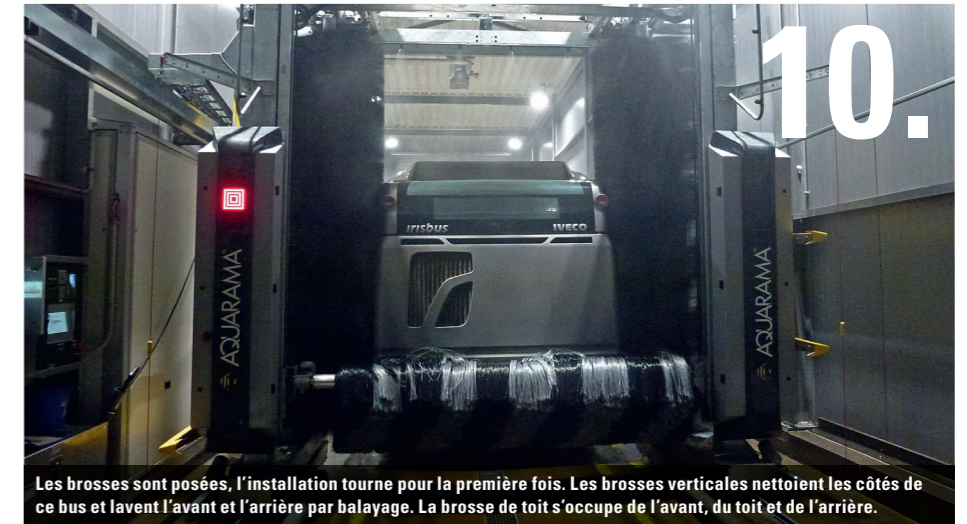
10. Les brosses sont posées, l'installation tourne pour la première fois. Les brosses verticales nettoient les côtés de ce bus et lavent l'avant et l'arrière par balayage. La brosse de toit s'occupe de l'avant, du toit et de l'arrière.