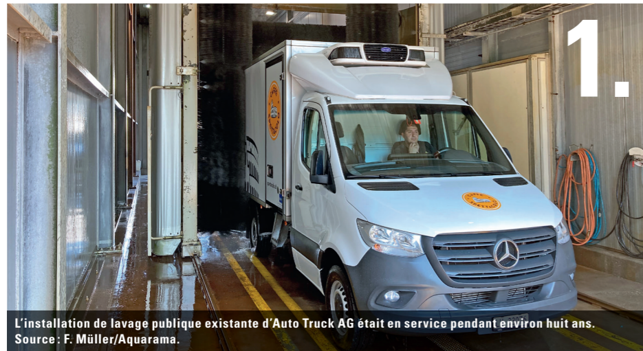
1. L'installation de lavage publique existante d'Auto Truck AG était en service pendant environ huit ans.