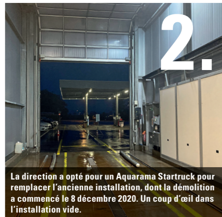
2. La direction a opté pour un Aquarama Startruck pour remplacer l'ancienne installation, dont la démolition a commencé le 8 décembre 2020. Un coup d'œil dans l'installation vide.