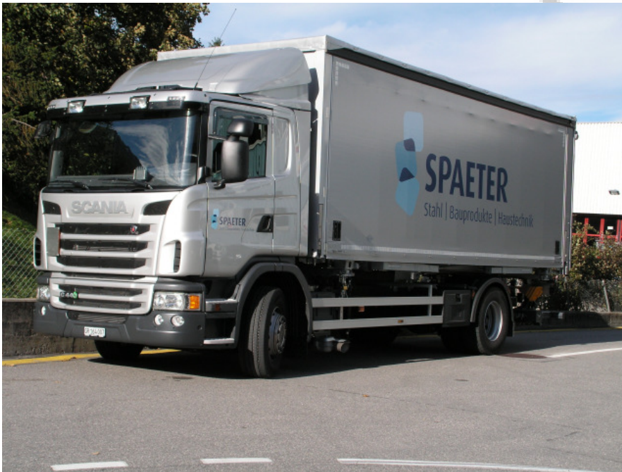
Der erste Euro-6-Scania im Kanton Graubünden ist ein Scania G440 LB 4x2.

Scania Schweiz AG Steinackerstrasse 57 CH-8302 Kloten