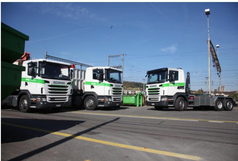
Die drei neuen Fahrzeuge im Fuhrpark der Max Maag AG in Winterthur

Scania Schweiz AG Steinackerstrasse 55 CH-8302 Kloten / ZH