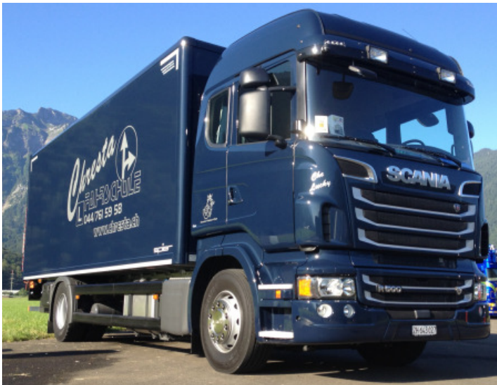
Der Scania R500 LB 4x2 der Chresta GmbH in Affoltern am Albis.